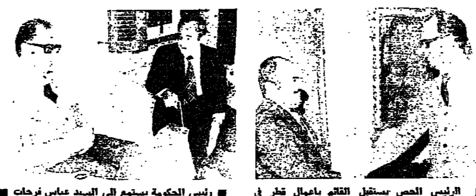
الرئيس الحص يستقبل القائم بعمال قطر في لبنان ■ رئيس الحكومة يستمع إلى السيد عباس فرحات

السيد يوسف فبيدان واجتمع إليه مدة (٥) دقيقة صرح على الزملاء عبيدان : شرحت بمغفلة الرئيس سليم الحص، ويقطع نقول الحديث آخر التطورات وعلى رأسه المسؤولية العربية المشتركة، والسلام في المنطقة، وخاصة في جنوب لبنان لا يزال حتى الآن خارج الخطة الأمنية، والتي يعيها المسؤولون اللبنانيون بكل جهد لتسهيل القسري الحدية، وتفرغ سيطرتها على الوضع القسري لتتجهز في كل لحظة.